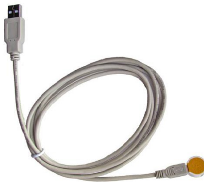
Fig. 3. Elettrodo per l'acqua con induttore esterno